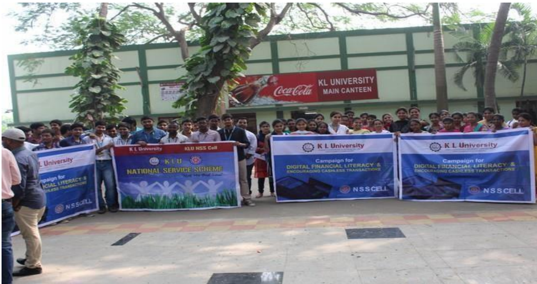
NSS volunteers before to go to campaign

From the directions of VISAKA, MHRD and State NSS Cell for conducting drives on cashless economy. NSS CELL has conducted a “Campaign FOR DIGITAL FINANCIAL LITERACY & ENCOURAGING CASHLESS TRANSACTIONS” in two villages on 31 st December 2016. The students have explained how to make cashless through normal mobile phones and smart phones, and created awareness to make digital transactions. And, explained the pro’s of using and the digital money instead of liquid money to the village people and shops of mellempudi and Revendrapadu. The volunteers have cleared all the doubts about the cashless transactions using wallets and internet banking.