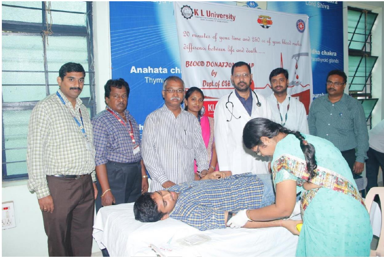
1. Starting by Dean (Student Affairs) and Others